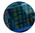
IT、银行和保险 CMMI, AGILE