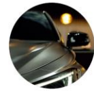
汽车电子 ASPICE, ISO 26262, SOTIF, FMEA