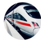
轨道交通 CENELEC EN 50128